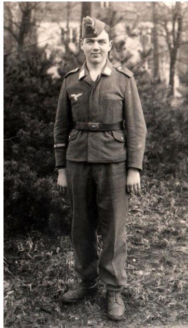
Als siebzehnjährige Grenadier der Division Hermann Göring in Berlin-Reinickendorf