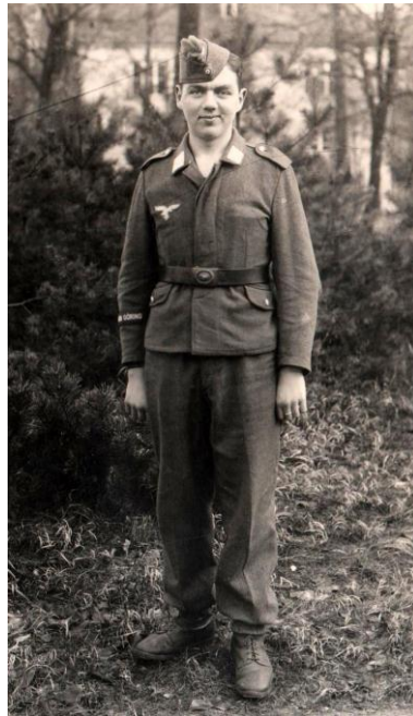
Als siebzehnjährige Grenadier der Division Hermann Göring in Berlin-Reinickendorf